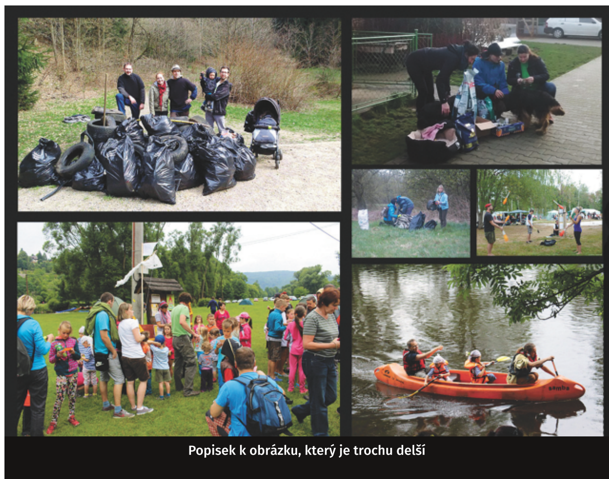
Popisek k obrázku, který je trochu delší